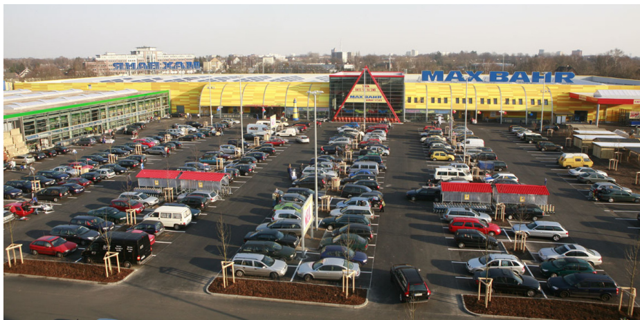
Neues Flaggship in Hamburg: auf 15.400 Quadratmeter werden rund 60.000 Artikel im neuen Max Bahr Markt in Stellingen angeboten.

Im Zuge der Zwei-Marken-Strategie wird Max Bahr als serviceorientierter Premium-Anbieter mit hoher Sortimentskompetenz zielgerichtet weiterentwickelt. Die Sortimentstiefe und -breite soll durch die stärkere Verwendung von Eigenmarken, aber auch durch ein größeres Angebot an A-Marken weiter vergrößert werden. Eigenmarken sollen attraktiver gestaltet und durchgängig in allen Sortimenten eingeführt werden. A-Marken werden in speziellen Markenshops integriert und noch stärker hervorgehoben. Der Kunde kann so zwischen einer Vielzahl von Marken zu unterschiedlichsten Preisen wählen.