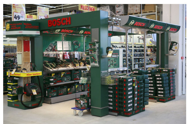
Präsentation von Marken-Produkten: Bei Praktiker (links) im Regal, bei Max Bahr als Shop-im-Shop (rechts).