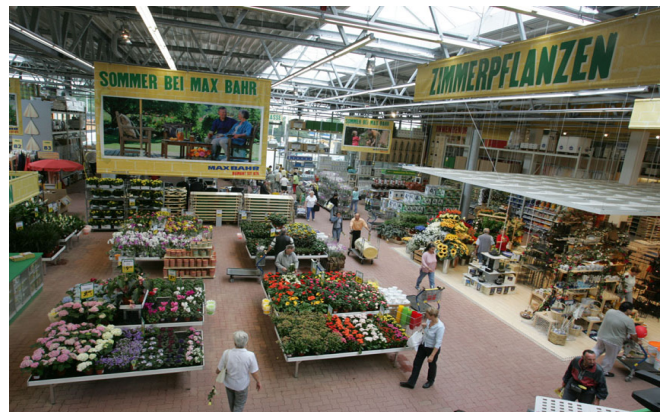
Das Gartensortiment: Konzentration auf das Wesentliche bei Praktiker (links), Vielfalt und Ambiente bei Max Bahr (rechts).