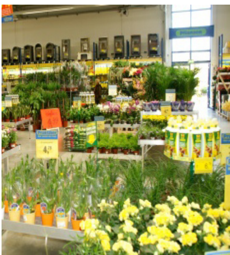
Das Gartengeschäft: Ein margenstarker Umsatztreiber.

Vorschläge der Europäischen Kommission zur Bekämpfung des Klimawandels und der Förderung erneuerbaren Energien http://ec.europa.eu/commission_barroso/president/focus/energy-package-2008/index_de.htm#key